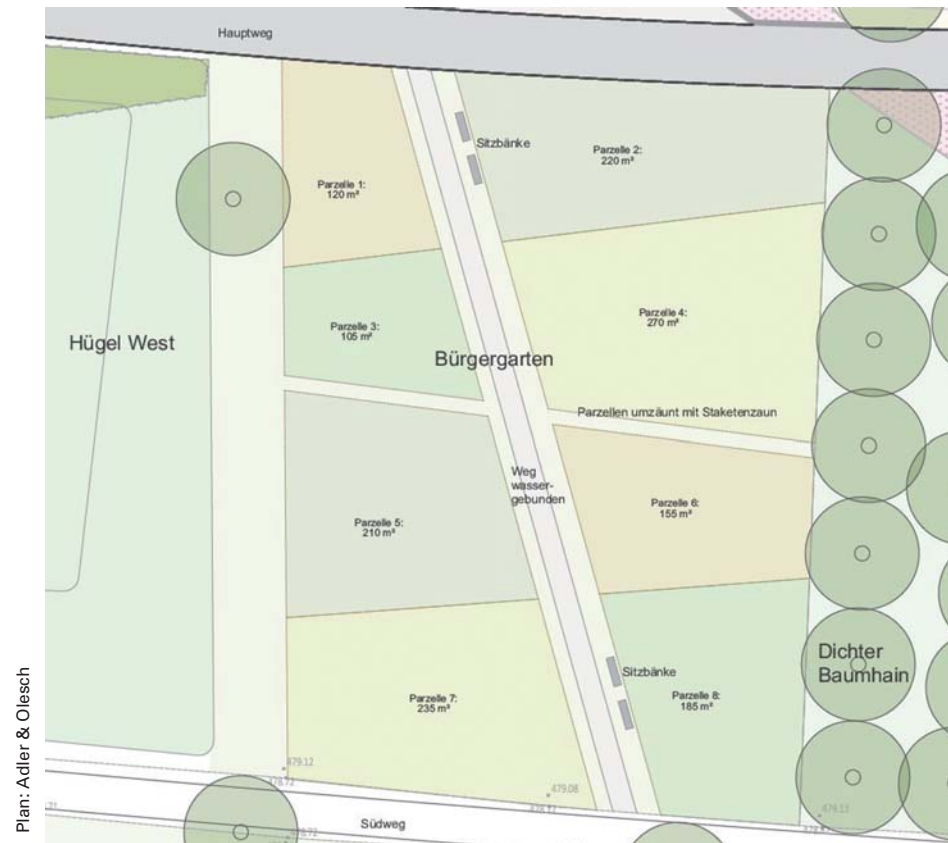
Plan: Adler & Olesch

Im Bürgergarten hat die Stadt noch Parzellen zu vergeben