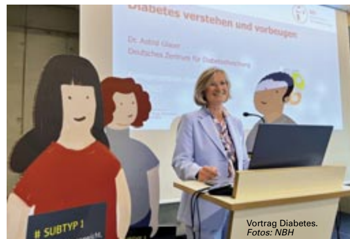
Vortrag Diabetes.