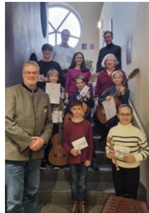
Die Preisträgerinnen und Preisträger aus dem 61. Regionalwettbewerb in München 2024.

Am 7. und 8. Februar 2026 hat die Musikschule Garching die große Ehre, zum ersten Mal den Regionalwettbewerb „Jugend musiziert“ auszurichten. „Jugend musiziert“ ist bundesweit der renommierteste Musikwettbewerb zur Findung und Förderung junger Talente und dient seit über 60 Jahren einerseits als Sprungbrett für internationale Karrieren und andererseits als musikalische Förderung einer breiten Masse. Er