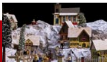
Gelöst: Gewinner des Weihnachtsrätsels