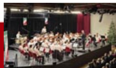
Gespielt: Grandioses Konzert des Blasorchesters