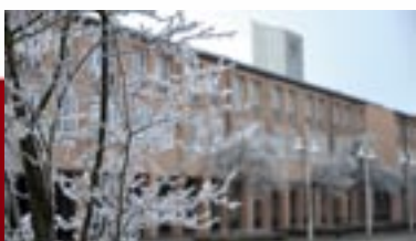
Geschrieben: Ausblicke der Garchinger Parteien

Die Kommunalwahl-Vorbereitungen gehen in die heiße Phase