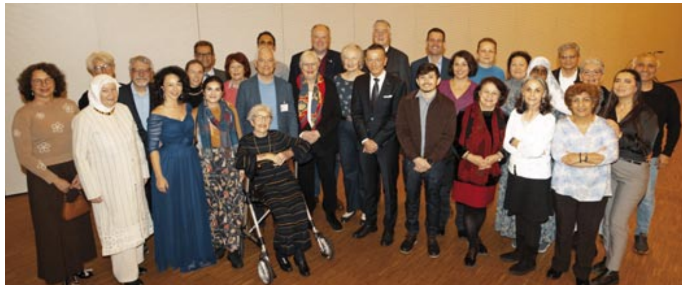
Aktuelle und ehemalige Mitglieder des Integrationsbeirats Garching mit den Ehrengästen.